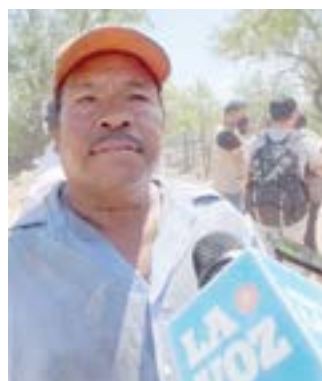
Gabriel no cree que los mineros estén con vida.

curso de la 1:00 de la mañana. “En el complejo andan haciendo unos barrenos