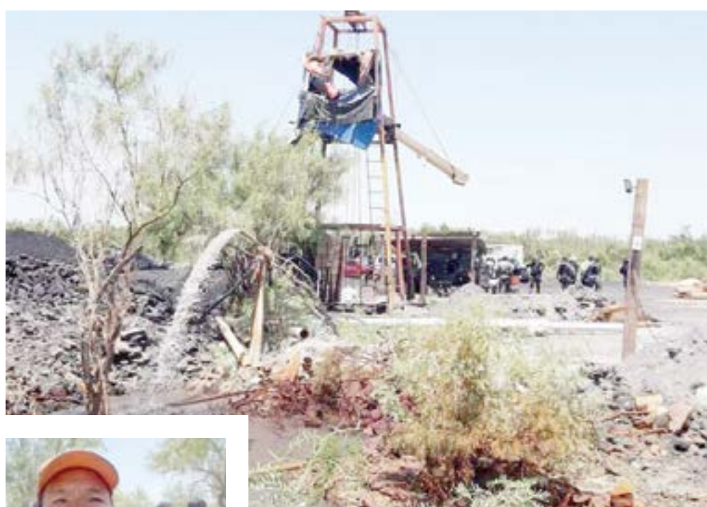
El agua subió 36 metros aproximadamente.

Reconoció que sí son suficientes las bombas de agua con las cuales se encuentran trabajando, pero, habrán de llegar otras 17 en el trans-