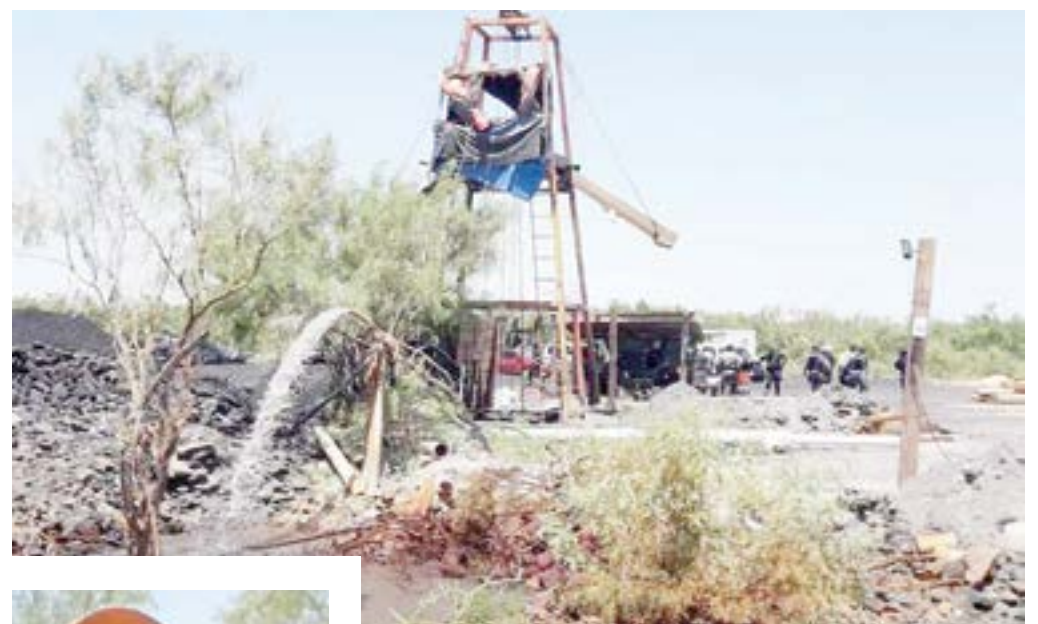
El agua subió 36 metros aproximadamente.

Reconoció que sí son suficientes las bombas de agua con las cuales se encuentran trabajando, pero, habrán de llegar otras 17 en el transcurso de la 1:00 de la mañana. "En el complejo andan haciendo unos barrenos