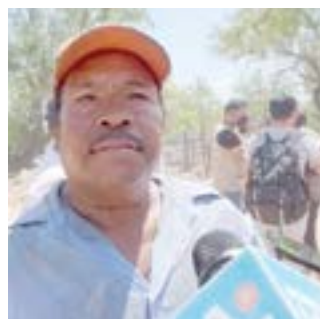
Gabriel no cree que los mineros estén con vida.

para meter unas bombas ahí y otras más en otro lugar” esperemos resultados pero sí es complicada la situación, externó Gabriel.