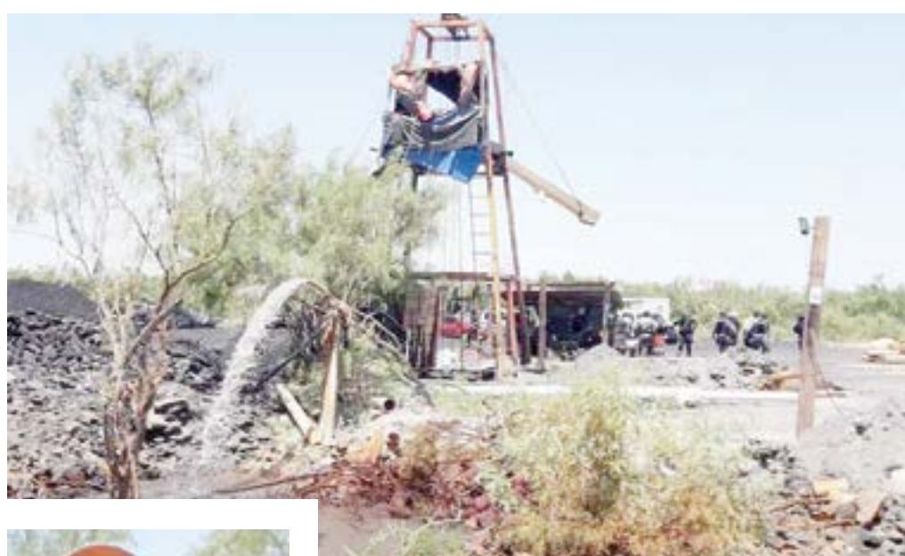
El agua subió 36 metros aproximadamente.

Reconoció que sí son suficientes las bombas de agua con las cuales se encuentran trabajando, pero, habrán de llegar otras 17 en el transcurso de la 1:00 de la mañana. “En el complejo andan haciendo unos barrenos