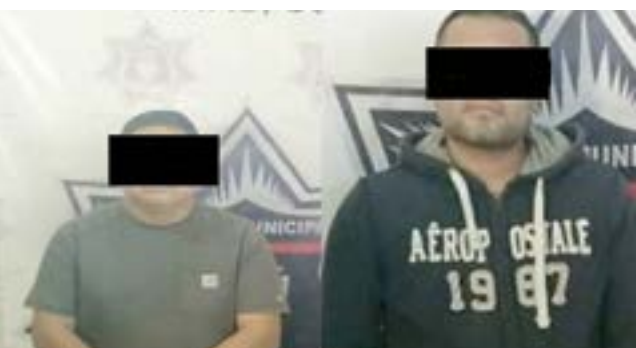
Estos son los 2 policías preventivos detenidos.