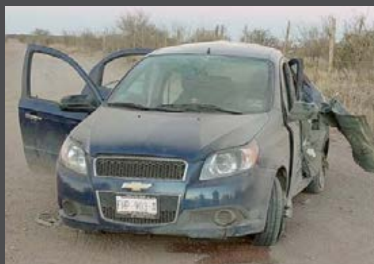
Los hechos se registraron en el camino que conduce de Saucedo del Naranjo al mineral de Palaú.

El lugar fue acordonado por las autoridades policíacas en tanto hacia su arribo un Agente del Ministerio Público para dar fe de lo ocurrido y ordenar el levantamiento del cadáver a fin de proceder a su identificación.