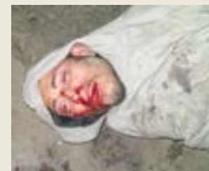
Linchan a ladrón vecinos hartos de tantos robos.

Ingresó a un taller mecánico, al verse sorprendido pedía perdón y se justificó por ser drogadicto