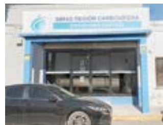
Cierran las oficinas regionales de SIMAS por contagio de covid-19.

Las secretarías que resultaron contagiadas están trabajando desde sus hogares, para evitar que se